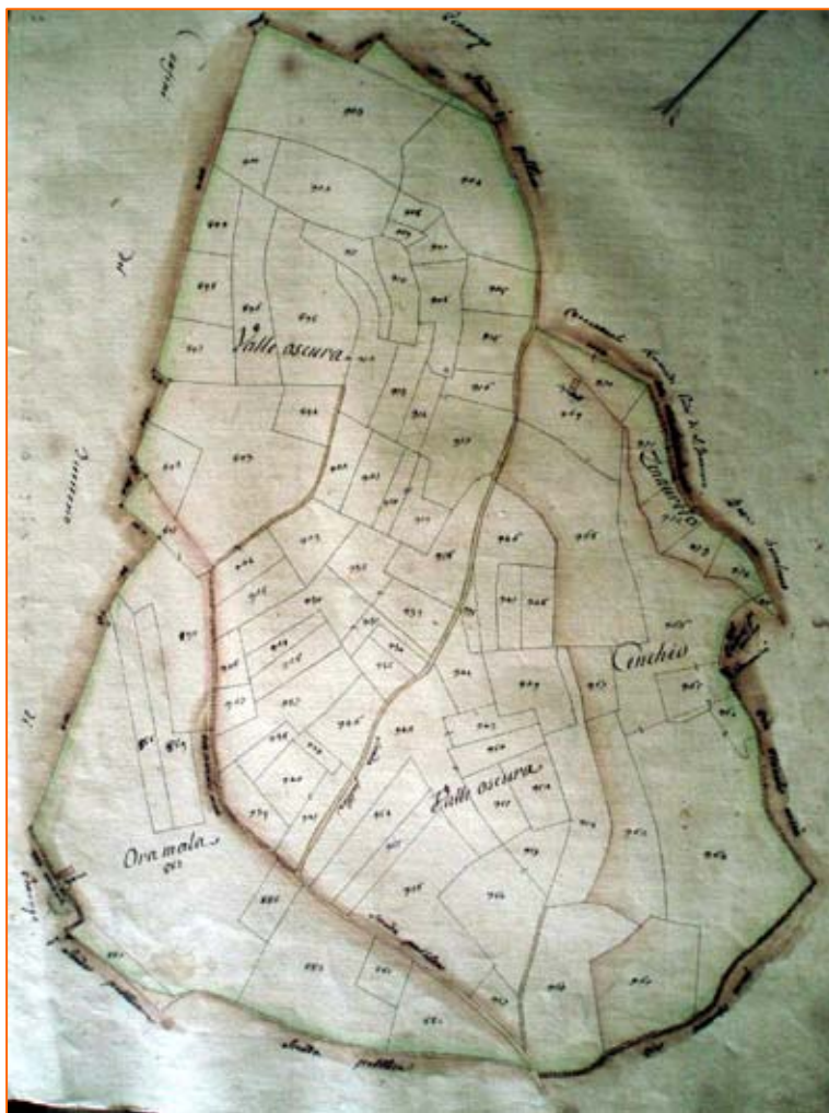
La regione Vallescura nella mappa catastale del 1781

Il Pidrin , svegliato anch'egli, appena sentì parlare del fatto del diavolo nella camera degli sposi, gli venne da ridere e commentò: "Lui [lo sposo] ha fatto il diavolo in chiesa e ora Gesù Cristo gli ha mandato quello vero in casa sua". Infatti, finita la Messa solenne dello spozalizio, lo sposo (che era di carattere completamente diverso da quello della mamma) aveva contestato – e qui non posso assicurare se si trattasse del Vicario di Grazzano oppure dell'Arciprete di Patro, ma siccome lo sposo era delle cascine sotto la Parrocchia di Patro e la sposa di quelle sotto Gra-